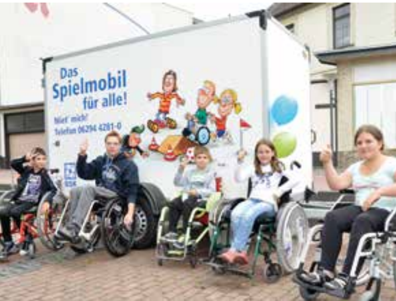
BSK-Spielmobil für alle