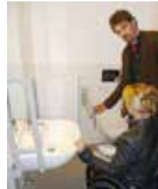
Besichtigung der Musterwohnungen