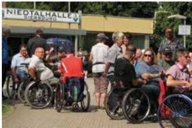
Barrierefreie Wanderung in Siersburg