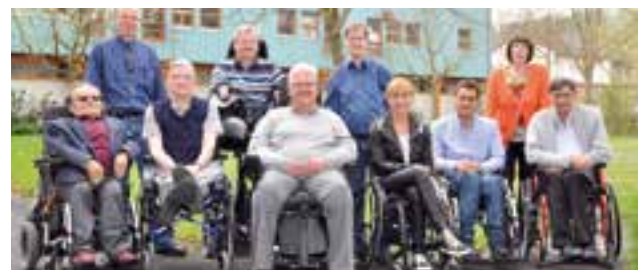
BSK-Landesvertreter/-innen trafen sich in Krautheim mit dem vertretungsberechtigten Bundesvorstand

Zum Treffen vom 4. bis 6. April 2014 in Krautheim fanden sich insgesamt 14 Teilnehmende ein. Themen waren u. a.: