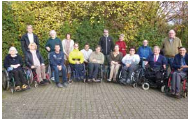
Delegiertenversammlung in Duderstadt

Die Delegiertenversammlung ist das Aufsichtsgremium des BSK e.V. und für die Kontrolle der Einhaltung der satzungsgemäßen Ziele verantwortlich. Die Delegiertenversammlung ist die Zusammenkunft der von den ordentlichen Mitgliedern (§ 5 Abs. 4) für die Dauer von 4 Jahren direkt gewählten Delegierten.