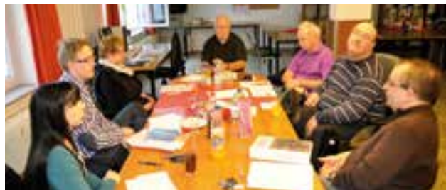
Schulung „Stärkung der Selbsthilfe in der Praxis“ in Krautheim

Die Schulung „Stärkung der Selbsthilfe in der Praxis“ fand vom 26. bis 28. März 2014 in Krautheim statt. Zielgruppe sind ehrenamtliche Funktionsträger in der Selbsthilfe, die vor kurzem eine entsprechende Funktion übernommen haben.