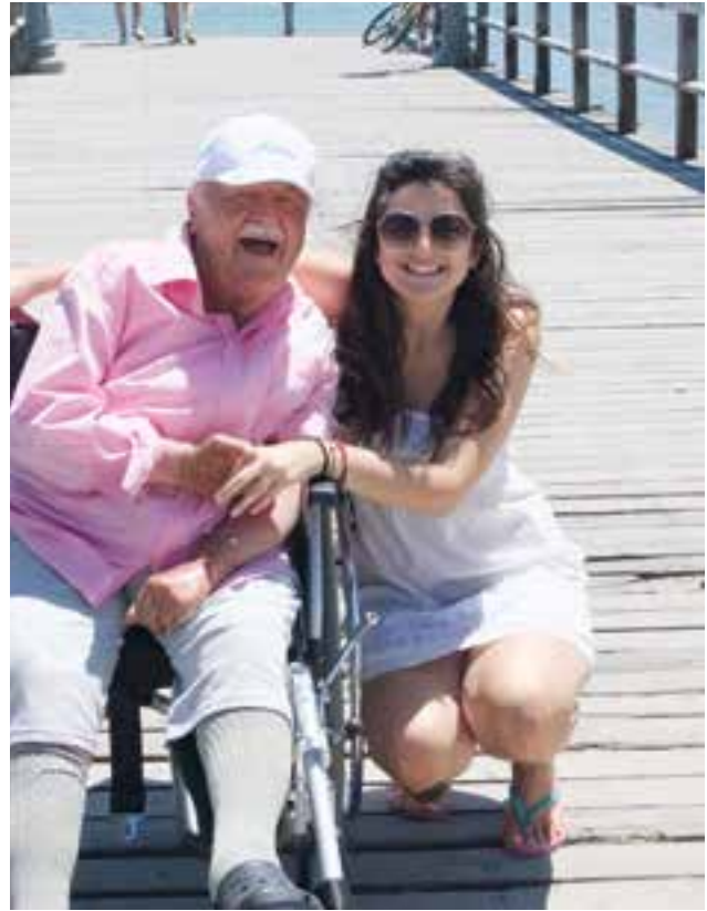
Urlauber mit einer Reiseassistentin auf der Gruppenreise nach Griechenland

Während zwei internen Klausuren wurde an dem Konzept „Zielsystem der BSK-Reisen GmbH“ weitergearbeitet. Es wurden unter anderem qualitative Verbesserungen in den Reisekatalog 2015 eingearbeitet; es wurden Mindeststandards für die Un-