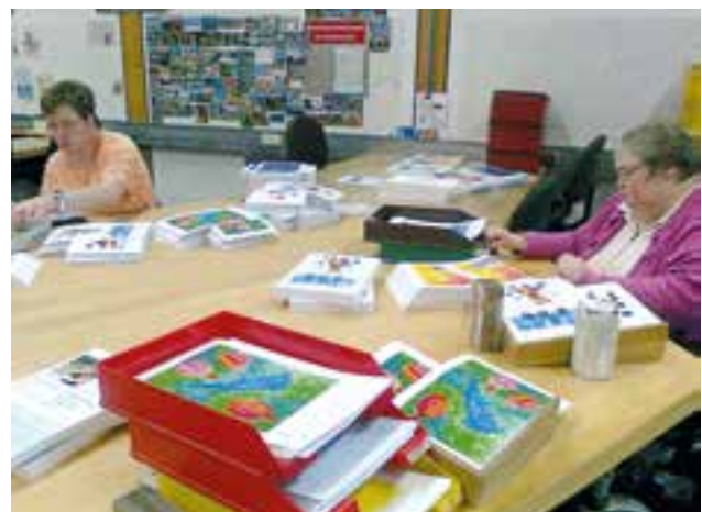
Produktion des BSK-Kalenders „Kleine Galerie“ mit Gemälden von Kindern mit Behinderung in der WfbM in Krautheim