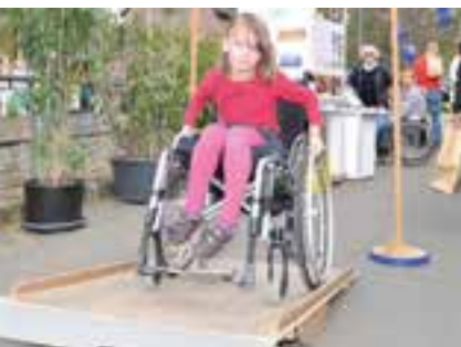
Das BSK-Spielmobil in Burgen