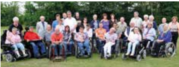
Bereichsleitertagung in Duderstadt