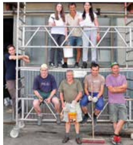
Mitglieder des Bauordens halfen dabei, die Halle des BSK e.V. zu renovieren