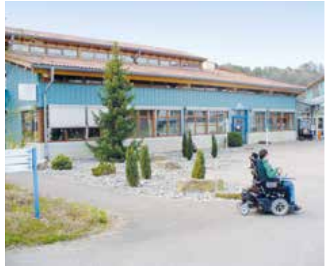
Blick auf den Gebäudekomplex der Krautheimer Werkstätten

Auch im Berichtsjahr fand der „Internationale Tag der Menschen mit Behinderung“ in der Neuensteiner Stadthalle statt. Ziel und Zweck ist es, auf besondere Belange in der Behindertenarbeit und -politik hinzuweisen und Maßnahmen einzufordern.