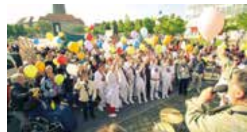
Menschen mit und ohne Behinderung demonstrieren gemeinsam in Dresden

Allen Teilnehmenden ist die Wichtigkeit der Thematik Inklusion und Leben mit Behinderung bewusst. Wichtiges Anliegen war u. a. der Übergang von Schule oder Ausbildung in den Beruf, der sich für Menschen mit Behinderung schwierig gestaltet. Alle anwesenden Kommunalpolitiker/-innen waren sich einig, dass der Weg zu einem inklusiven Dresden und der Umsetzung des städtischen Aktionsplans noch weit ist, aber viele Chancen birgt.