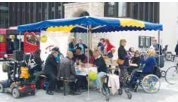
5. Mai Aktion in Memmingen

5. Mai 2015: Der Behindertenbeirat der Stadt Memmingen beteiligte sich am Europäischen Protesttag zur Gleichstellung von Menschen mit Behinderung mit einem Informationsstand am Theaterplatz. Mit der diesjährigen Aktion wollte die Stadt Memmingen die Bürger/-innen über die Bedeutung der Inklusion aufklären. Hierzu gehöre, dass jeder, ob mit