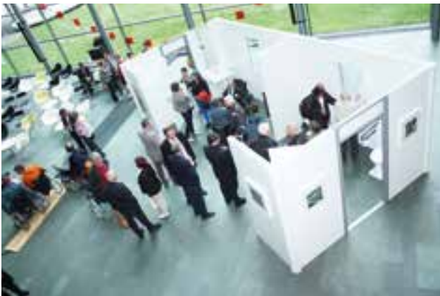
Wanderausstellung „Barrierefrei Bauen“

Der Landesverband Selbsthilfe Körperbehinderter Baden-Württemberg e.V. kann auf ein Jahr mit einer Vielzahl von Aktivitäten zurückblicken. Die Wanderausstellung „Barrierefrei Bauen“, die an zehn verschiedenen Orten im Land Station machte, gehörte sicher zu den herausragenden Ereignissen im vergangenen Jahr. Die Konzeption der Ausstellung fokussierte auf einige besonders wichtige Kernthemen der Barrierefreiheit. In zwei Räumen sowie auf angrenzenden Rampen fanden die Besucher/-innen viele Möglichkeiten, sich der Bedeutung baulicher Details für Menschen mit Behinderung